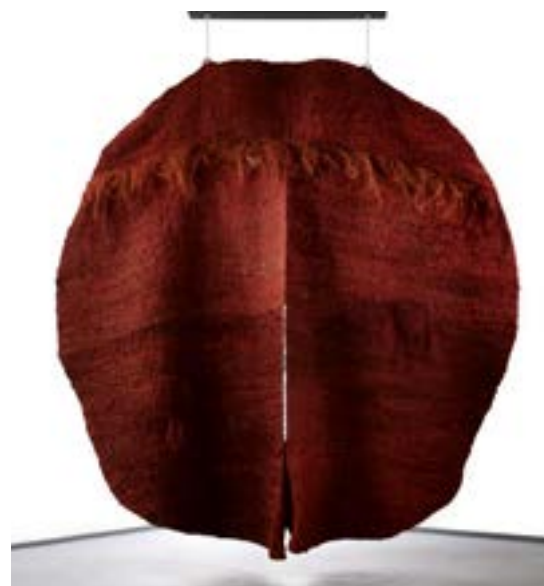
▶ Magdalena Abakanowicz, Abakan rouge III, 1970-1971, sisal, 300 x 300 x 45 cm Fondation Toms Pauli.