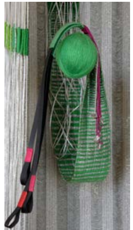
▶ Elsi Giauque, Hommage à Meret Oppenheim , 1985 (détail). Laine, lin, raphia, coton, métal, miroir, 220 x 100 x 100 cm. Fondation Toms Pauli.