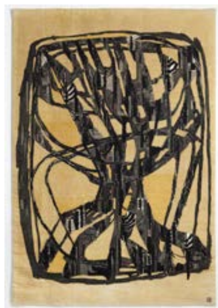
▲ Lissy Funk, Lebensbaum , 1964, lin, coton, 204,5 x 141 cm. Fondation Toms Pauli.