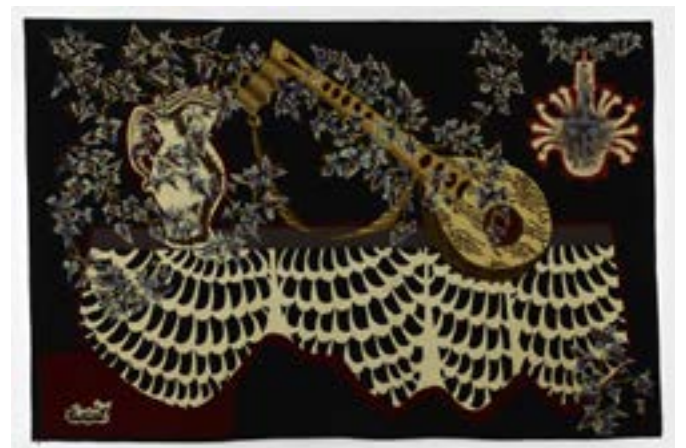
▲ Jean Lurçat, Mexico , 1954, laine, 151 x 231 cm. Fondation Toms Pauli.