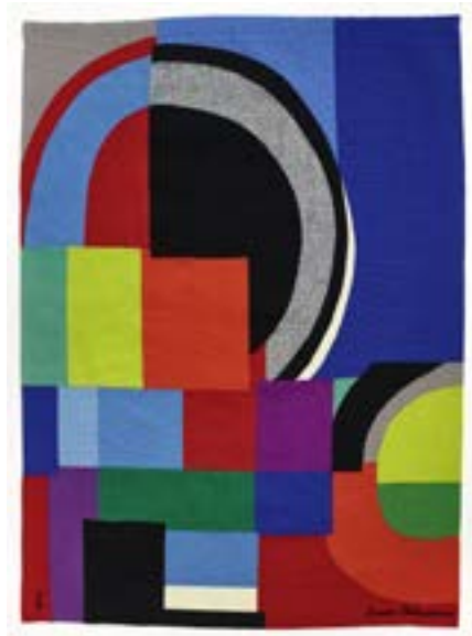
◀ Sonia Delaunay, La Courbe grise, 1970-1972, laine, 183 x 135 cm. Fondation Toms Pauli.

Des vues des salles seront disponibles dès le 24 mars 2016.