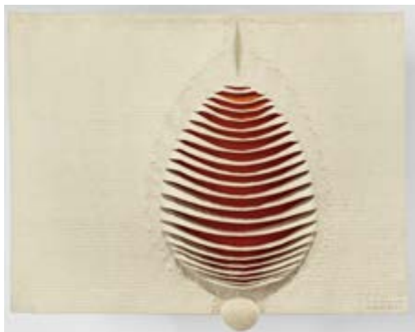
▲ Pierre Daquin, Devenant , 1968, laine et fils d'or, 120 x 195 cm. Fondation Toms Pauli.